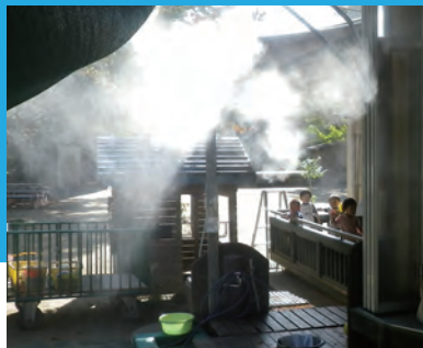
保育園・幼稚園・学校