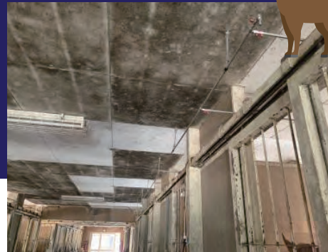
全箇所止水バルブ付