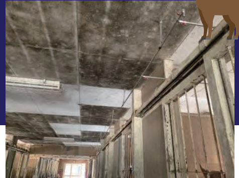
全箇所止水バルブ付